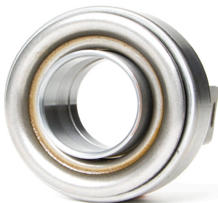
Fig. 1: Rulmenții de presiune cu bucșă metalică se lubrificază