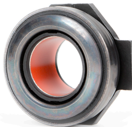
Fig. 3: Rulmenții de presiune cu bucșă din PTFE nu se lubrificază

Respectați specificațiile producătorului autovehiculului!