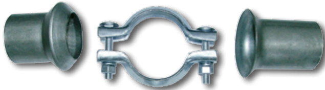
Reparatur-Set I (inkl. Klemmstück kpl.)