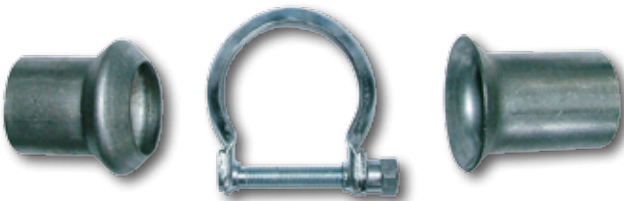
Reparatur-Set II (inkl. Rohrschelle)