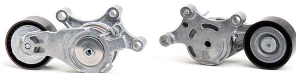
Figura 2: Nou design

În cadrul eforturilor noastre continue de a ne îmbunătăți produsele, am făcut modificări la întinzătorul de curea cu nr. reper 534 0075 20.